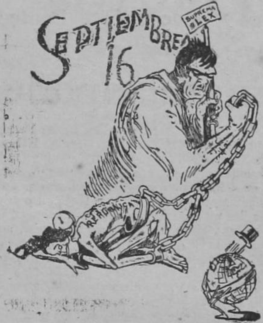
De cómo encuentra la República mexicana el aniversario de su Independencia (De La Prensa de San Antonio, Texas).